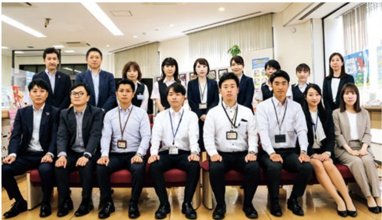
大分銀行 中島支店の皆さん