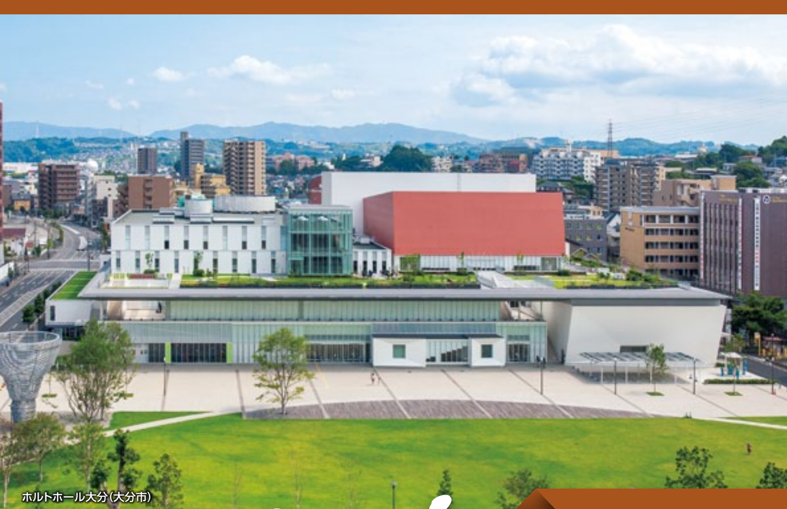
ホルトホール大分(大分市)